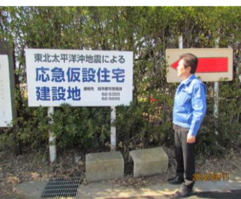
応急仮設住宅の看板を見て...