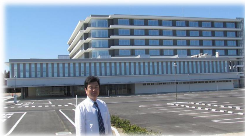
東金市に4月から開院される東千葉メディカルセンターにて

袖ヶ浦福祉センター養育園、更生園、アドバンスながうら等に対する立入検査で聴取と書類調査を実施しところ、過去10年間で職員15人の虐待行為と3人の虐待疑義が認められ、この情報を得た幹部の対策の不備があり、運営体制に多くの問題が明らかになったことを踏まえ、各関係者に対する厳正な処分を求めるほか、事業団幹部を刷新する追加勧告を行うなどの指導を行った。