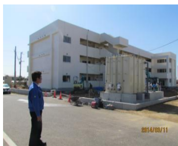
復興住宅を見つめて...