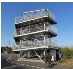
高さ、8メートルの避難タワー