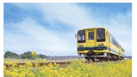
いすみ鉄道に揺られて

鉄道事業者にとって、安全で安定的な運行を確保することは重要事項であると捉え、県内中小鉄道事業者が行う安全性向上に向けた設備費に対する支援を実施しておりますが、加えて、平成26年度からは、銚子電鉄が行う線路や踏切設備の整備費等に対する支援を決定したところで、今後も安全運行に資する支援をしてまいります。