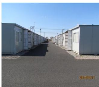
三年経ても仮設生活か...