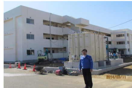
旭市の復興住宅の建設現場にて

九十九里沿岸60キロのうち、津波対策が必要な29キロ区間内で最も津波被害が著しかった旭市などでは堤防工事を実施しており、また、平成26年度から有料道路のかさ上げなどを含めた沿岸の全てで本格的に工事を行うことで平成27年度の整備完成を目指しています。