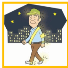
自身を守るため反射材を付けましょう

減少に向けては、薄暮時間帯の交差点関連違反の取締り強化、高齢者への交通安全指導及び運転免許証の返納を呼びかけるほか、歩行者・自転車に反射材の着用などを呼びかけ「3(サン)ライト運動」の強化、また、「春の全国交通安全運動」でも関連機関と連携を図り、特に、高齢者の事故防止に努めてまいります。