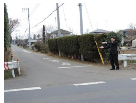
県道岩富山田台線と御成街道の交差点に信号機設置に向けて