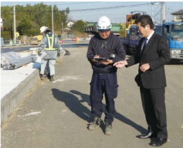
開通が待たれる横芝バイパス